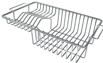
Tellerständer aus Edelstahl 8100 305